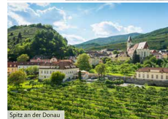
Spitz an der Donau