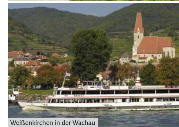
Weißkirchen in der Wachau